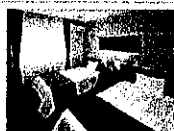
【禁煙】スタンダードルーム(20~21平米)