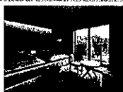
【禁煙】和室デラックス(34平米)